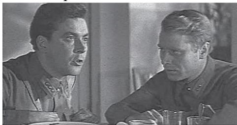
Кадры из фильма "По тонкому льду"

В своё время Ю. Семёнов отблагодарил за эту помощь, написав сценарий по книге Г. Брянцева «По тонкому льду», и он практически слово в слово повторяет лежавшую в его основе повесть. Кроме того, в фильме звучит замечательная песня о друге на стихи Михаила Матусовского: